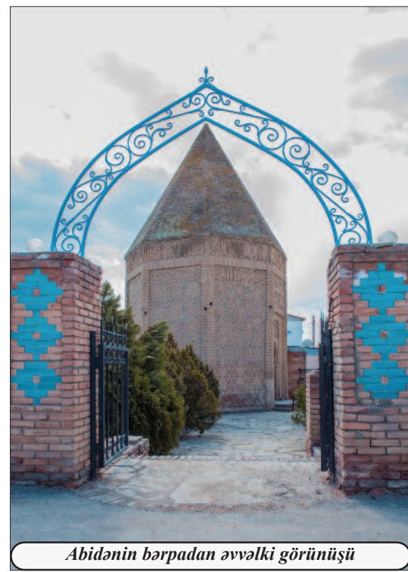
Abidənin bərpadan əvvəlki görünüşü

çatmatağ şəkilli sferik gümbəzə, xaricdən prizmatik gövdəyə malik olan türbə səkkizüzlü piramidal örtüklə tamamlanıb. Həm içəridən, həm də xaricdən bişmiş kərpiclə üzlənib. Türbənin xarici səthinin hər biri müxtəlifşəkilli həndəsi ornamentlərlə bəzədilib. Bu ornamentlər kiçik kərpiclərdən quraşdırılıb, sonra gəc məhlulu ilə tavanlar şəklində birləşdirilərək səthlərin üzərində möhkəmləndirilib. Quruluş etibarilə türbənin qərb tərəfə baxan səthi fərqli şəkildə həll edilib və burada türbənin giriş qapısı yerləşdirilib. Çatmatağ şəkilli bu qapının üzərindəki kitabədə yazılıb: “Bu